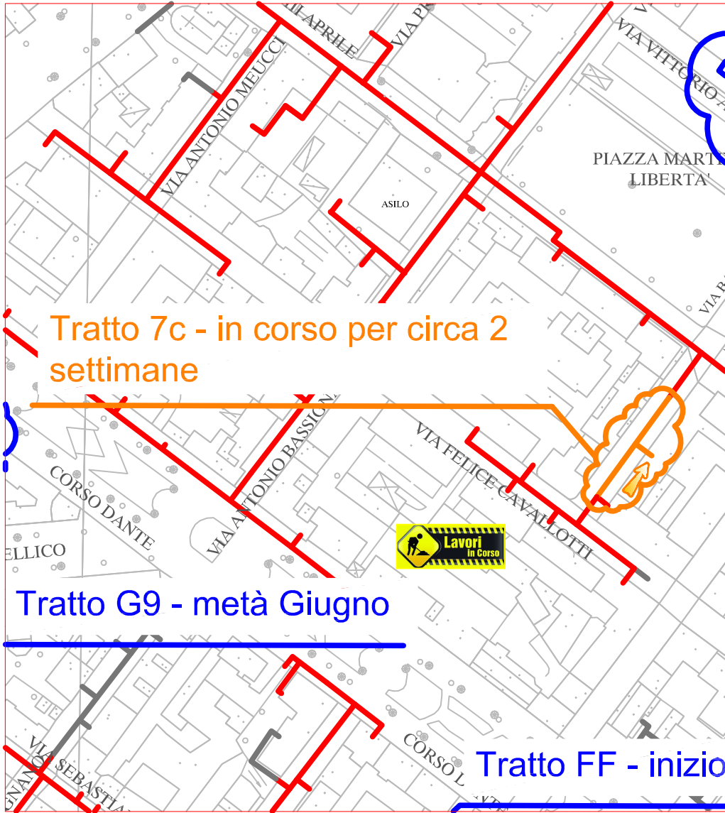
TRATTO DI SCAVO "7c"