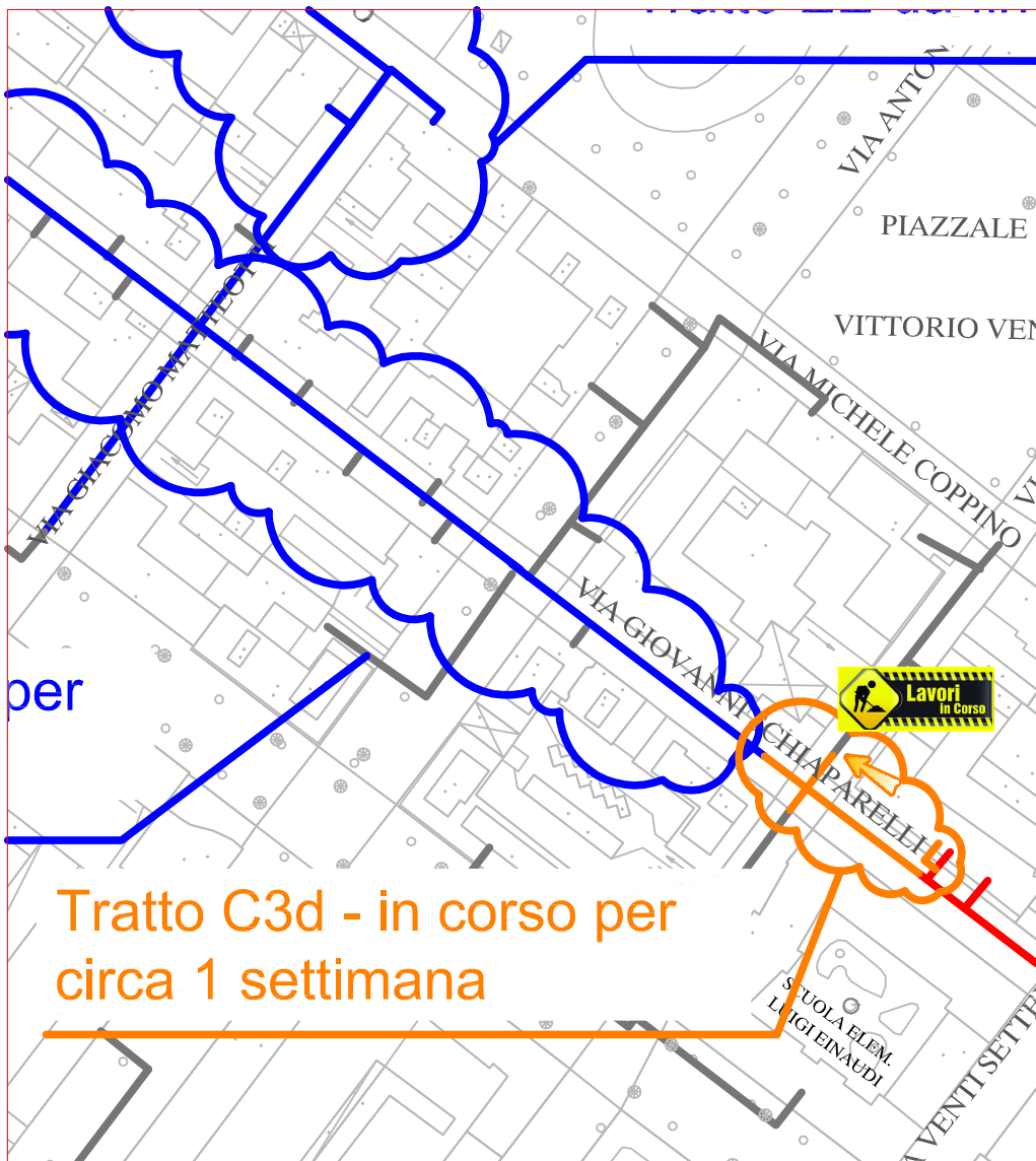
TRATTO DI SCAVO "C3d"